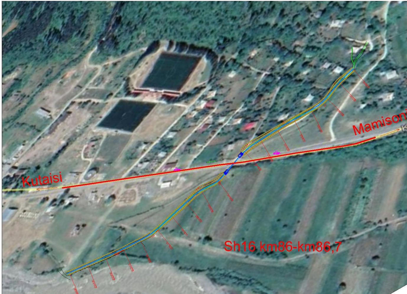
დანართი 1: პროექტის ადგილმდებარეობის რუკა ქუთაისი-ალპანა-მამისონის გზის (შ 16) მონაკვეთი კმ 86 - კმ 86.7 რეაბილიტაცია